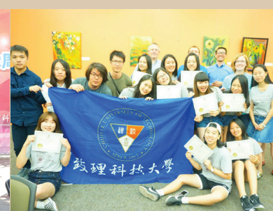
2016年本校學生暑期海外遊學團-密蘇里州立大學