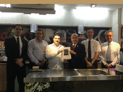
2016年東南亞文化週：東南亞@致理開幕儀式