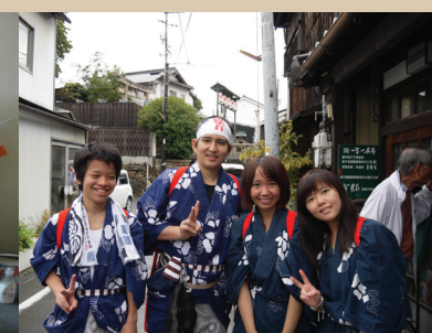
2014年學海飛颺-本校學生赴日本加計學園交換研習