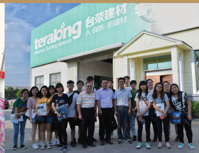
2017年大陸臺商經營實務-參觀浙江湖州臺榮建材公司