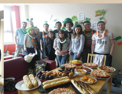
2014年學海飛颺-本校學生赴愛爾蘭國家學院交換研習