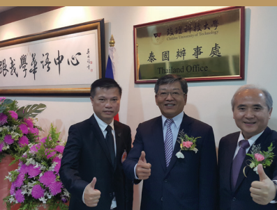
2017年本校駐泰國辦事處揭牌典禮，駐泰代表謝武樵大使(中)與尚世昌校長(右)、辦事處主任張宗傑博士(左)合影