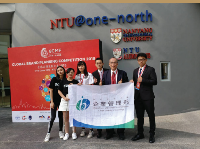
本校學生參加「2018年全球品牌大賽」新加坡總決賽榮獲季軍