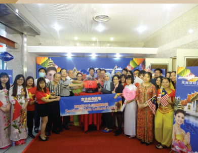
2017年東南亞文化訓練體驗營開幕典禮