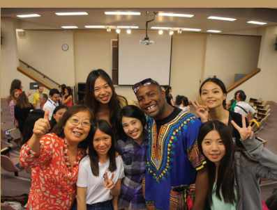
2016年本校學生暑期海外遊學團-密蘇里州立大學