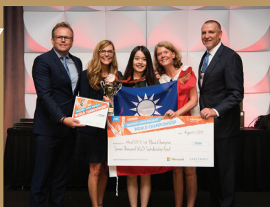
2018年本校學生參加「2018年世界盃電腦應用技能競賽」全球總決賽榮獲冠軍