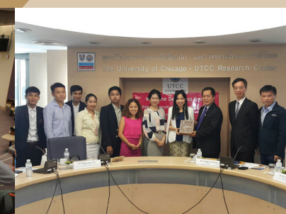
2015年本校學生暑期海外遊學團-加拿大皇家山大學