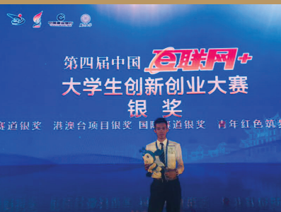
2018年本校學生參加「第四屆中國互聯網+大學生創新創業大賽」榮獲銀獎