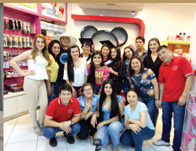
2017年學海築夢-本校學生赴巴拉圭POFI IMP-EXP S.R.L.海外實習