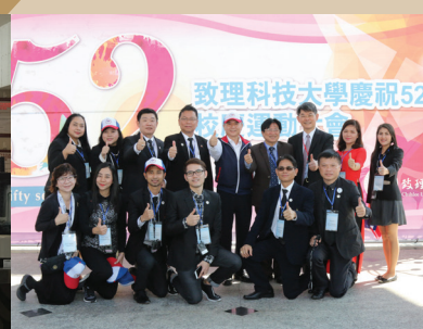
2016年泰國SSRU大學參訪團拜會本校52週年校慶