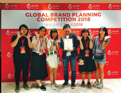
本校學生參加「2018年全國品牌策劃大賽」新加坡總決賽榮獲金質獎