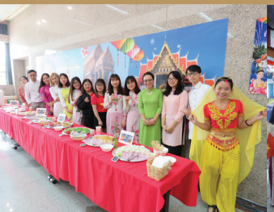
2017年東南亞文化訓練體驗營美食展