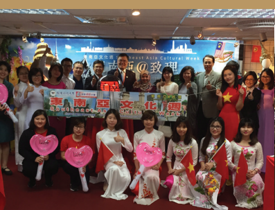
2016年東南亞文化週：東南亞@致理開幕儀式