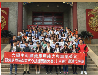
2018年本校學生參加「2018第八屆大學生計算機應用與專業英文海峽兩岸競賽-北京賽」榮獲雙料冠軍